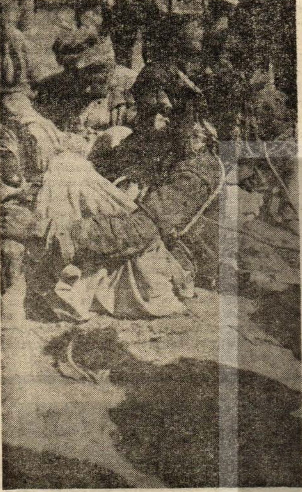
Dersim 1938: Esir Kürtler. Katliamların sorumlusu: Türk ve Kürt hakim sınıfları.

İşte Lenin'in çizdiği bu dünya tablosu içinde milli mesele, dünya çapında emperyalizme karşı mücadele meselesinin bir parçası niteliğini aldı. Emperyalizm ve proletarya devrimi çağında milli meselenin kazandığı bu özelliği, Stalin şöyle ifade etmektedir: